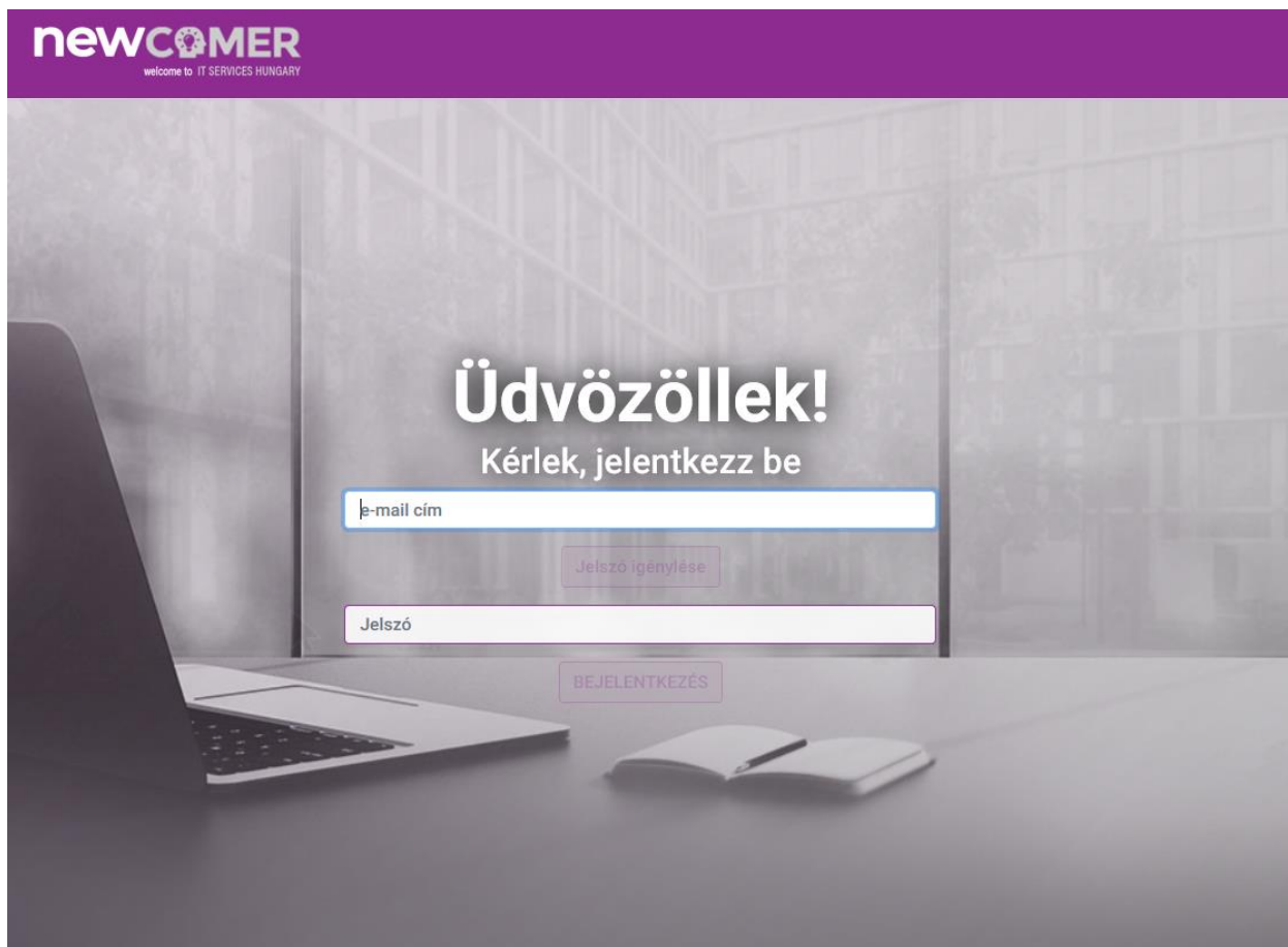
1. ábra - Üdvözlő oldal

Az adatvédelmi tájékoztató elfogadása utána a következő oldalt láthatod: